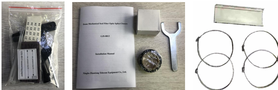
附件图片为检验参考, 不作为附件数量或者规格的检验依据