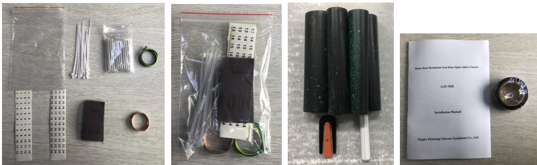
附件图片为检验参考，不作为附件数量或者规格的检验依据