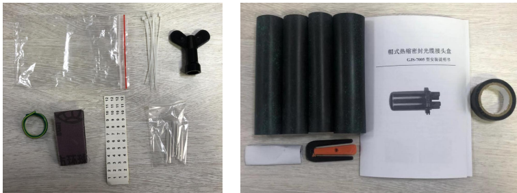
附件图片为检验参考, 不作为附件数量或者规格的检验依据