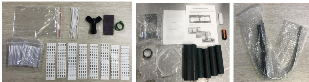
附件图片为检验参考，不作为附件数量或者规格的检验依据