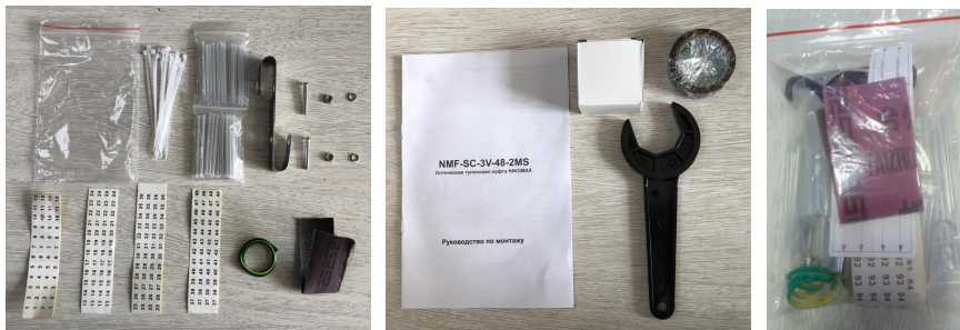
附件图片为检验参考，不作为附件数量或者规格的检验依据